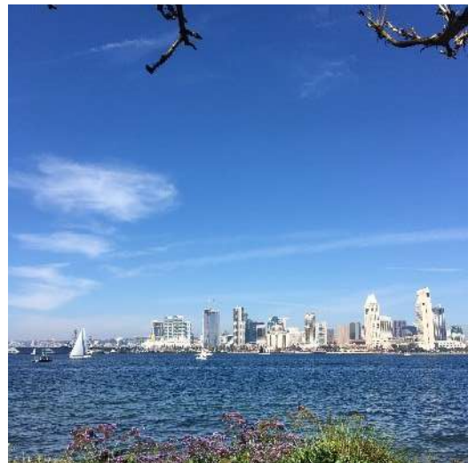
海の向こうのダウンタウン

その後シーポートビレッジと呼ばれるサンディエゴ湾に面した 公園とショッピングモールが合わさったような所で ランチ&ショッピング！！！！