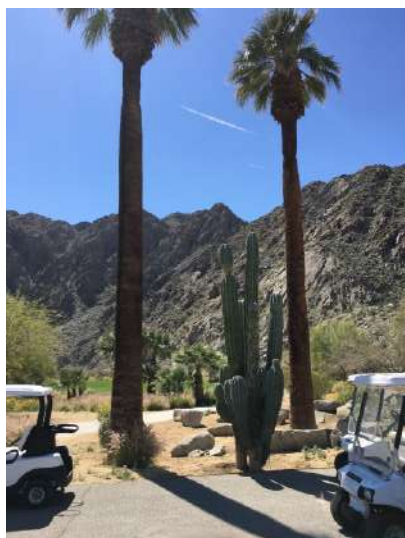
巨大な1つの岩のような山

サンディエゴを早朝に出発しパームに帰ってきた。 パーティーは終了。ゴルフ漬けに戻っていただく。 4ラウンド目はシルバロック。 PGAツアーでもトーナメントが開催される難関コース。 気合だ！！