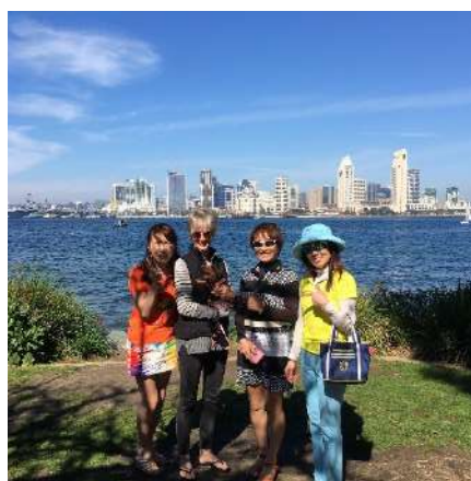
犬と散歩中のご婦人と